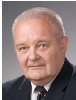
Współprzewodniczący Komitetu Programowego

Profesor Politechniki Gdańskiej i Uniwersytetu Technologiczno-Przyrodniczego w Bydgoszczy, Członek Komitetu Inżynierii Lądowej i Wodnej Polskiej Akademii Nauk, Członek zagraniczna Akademii Budownictwa Ukrainy