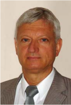
Співголова Програмного комітету член-кореспондент Національної академії наук України, заслужений діяч науки і техніки України, д. т. н., проф. ШИМАНОВСЬКИЙ Олександр Віталійович