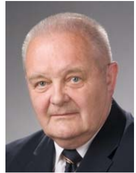
Co-Chairman of the Program Committee