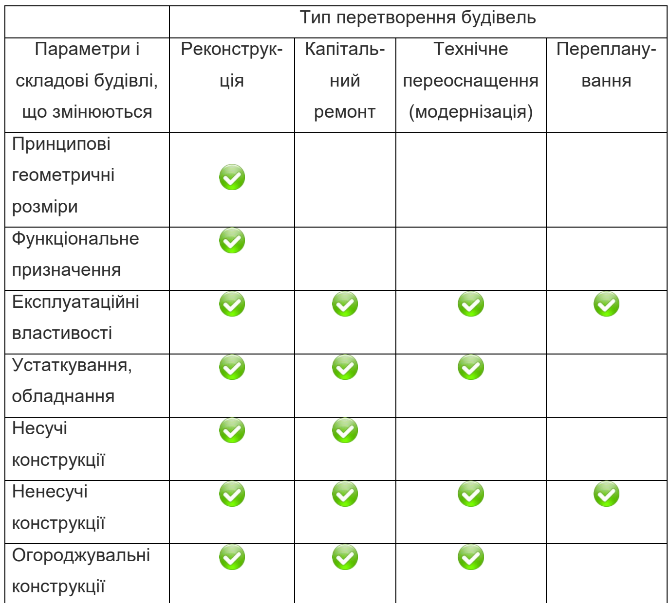
Таблиця 6.2 - Основні типи можливого перетворення будівель

Узагальнені основні типи можливого перетворення будівель з точки зору змін їх параметрів і складових наведено в табл.6.2.